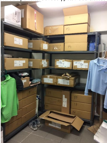
Βοηθητικός χώρος στο πατάρι του ακινήτου