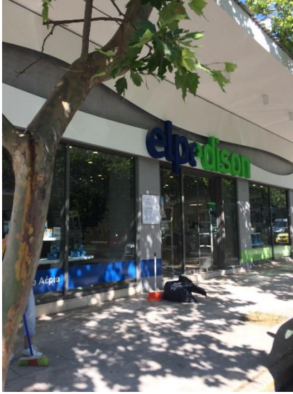
Όψη του ακινήτου από τη λεωφ. Κηφισίας