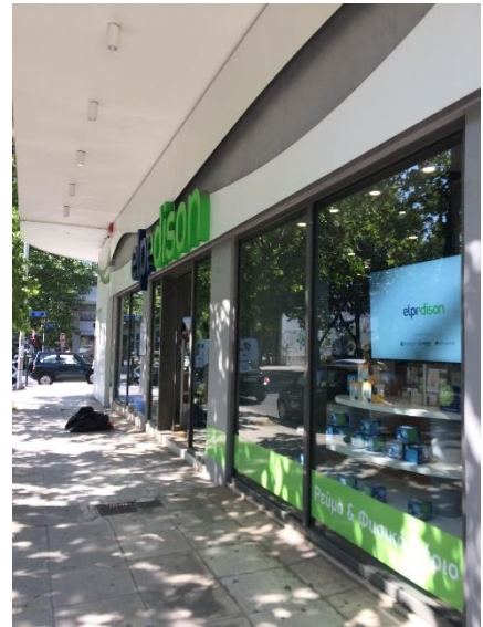
Όψη του ακινήτου από τη λεωφ. Κηφισίας