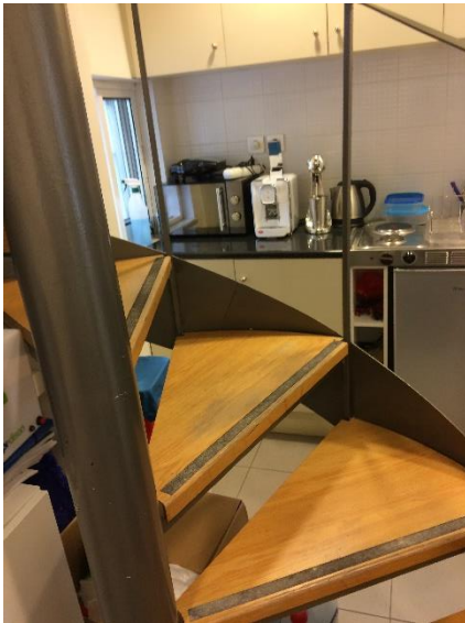
Μεταλλική σκάλα σύνδεσης των δύο επιπέδων