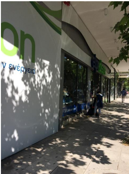
Όψη του ακινήτου από τη λεωφ. Κηφισίας