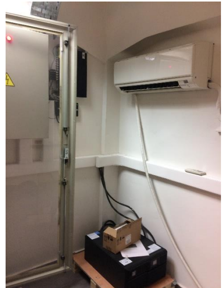
Χώρος Η/Μ εξοπλισμού στο πατάρι