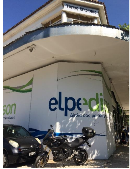
Όψη του ακινήτου από τη λεωφ. Κηφισίας