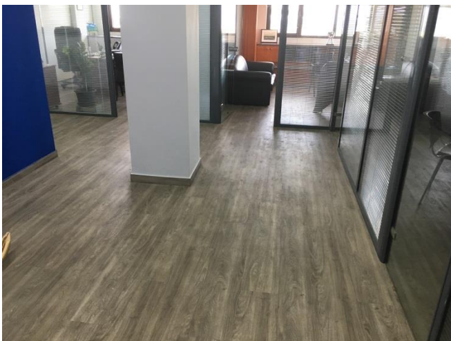
3 ος όροφος