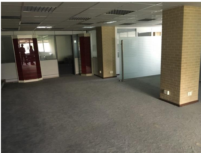
1 ος όροφος