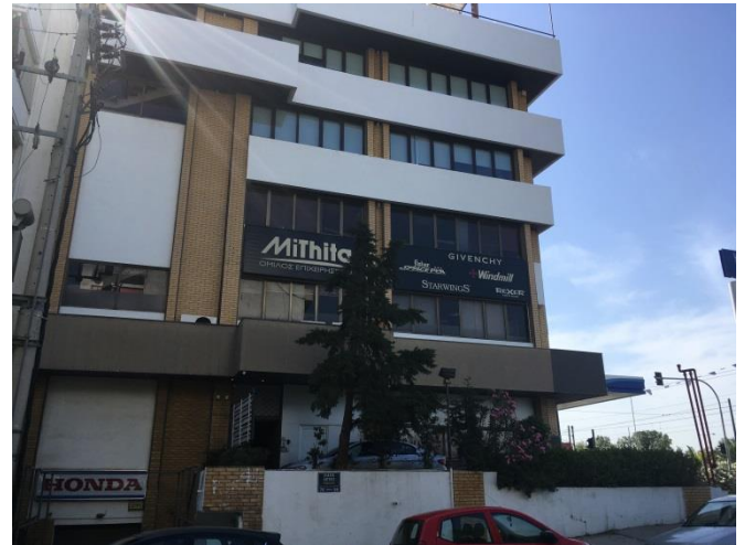
Όψη του ακινήτου από την οδό Αιγέως