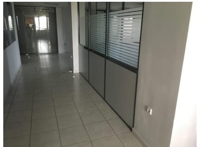
2 ος όροφος