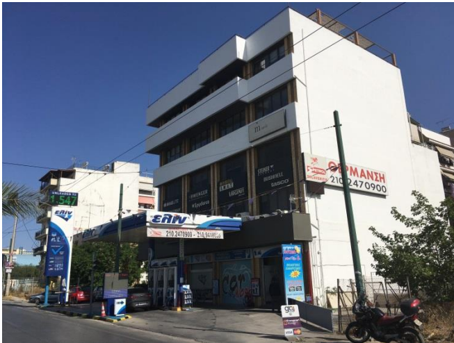
Όψη του ακινήτου από τη λεωφ. Ποσειδώνος