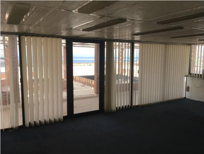
Εσωτερικά το δώμα