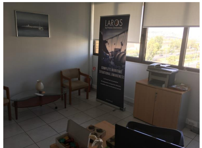
4 ος όροφος