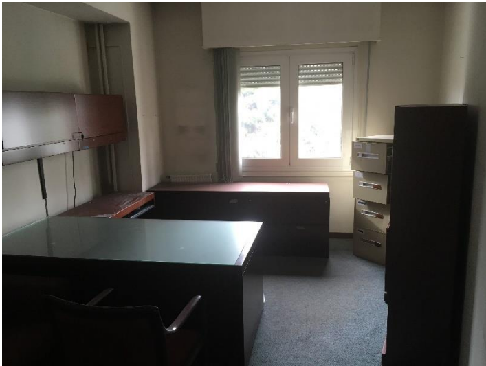
Εσωτερική όψη γραφειακών χώρων