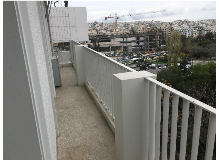
Θέα από το ακίνητο