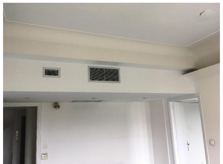
Εσωτερική όψη γραφειακών χώρων