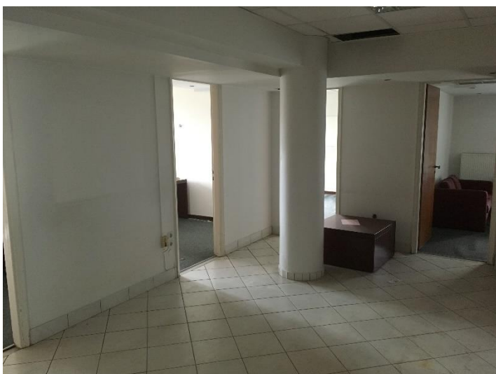
Εσωτερική όψη γραφειακών χώρων