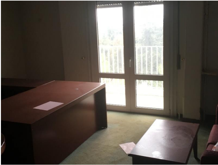
Εσωτερική όψη γραφειακών χώρων