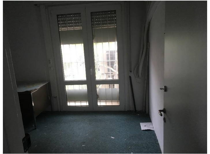
Εσωτερική όψη γραφειακών χώρων