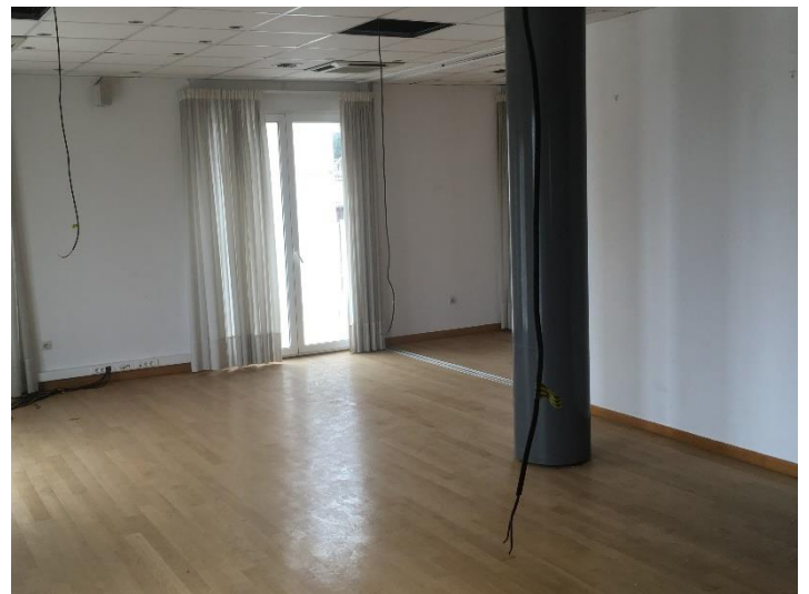
Εσωτερική όψη γραφειακών χώρων