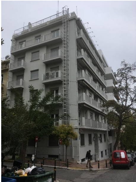
Εξωτερική όψη ακινήτου