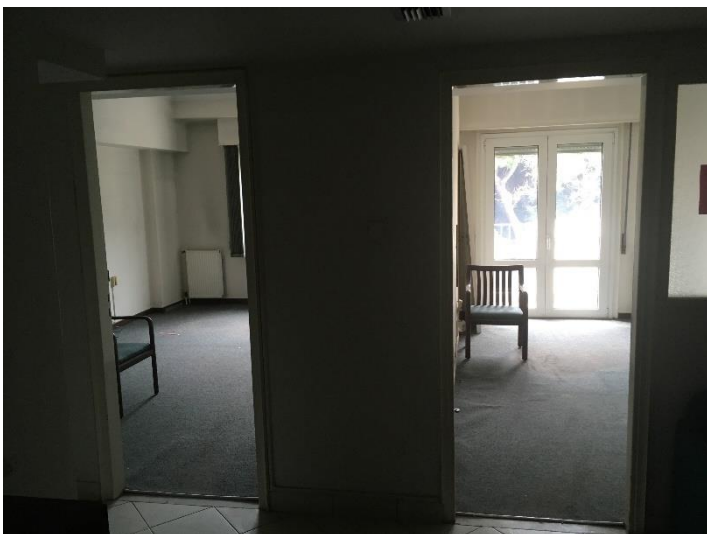
Εσωτερική όψη γραφειακών χώρων