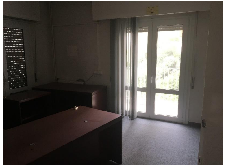
Εσωτερική όψη γραφειακών χώρων