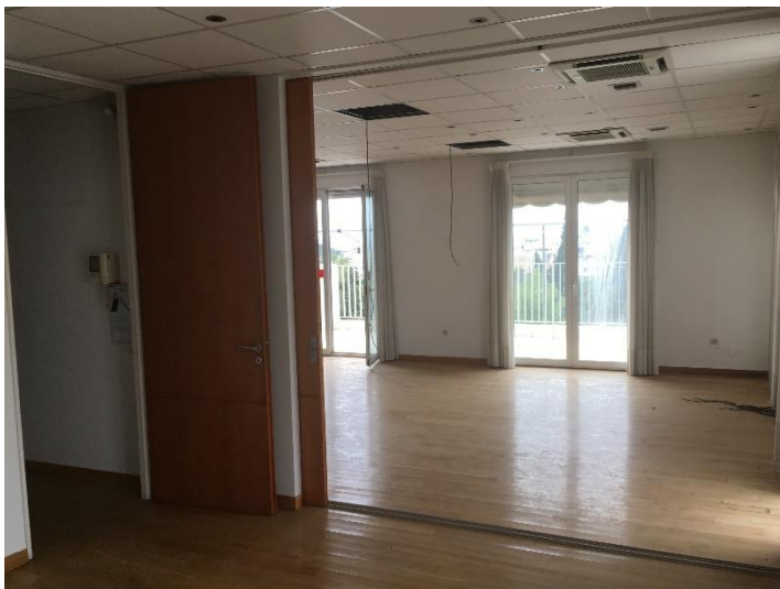
Εσωτερική όψη γραφειακών χώρων